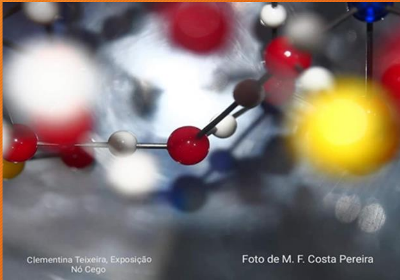
Clementina Teixeira, Exposição Nó Cego