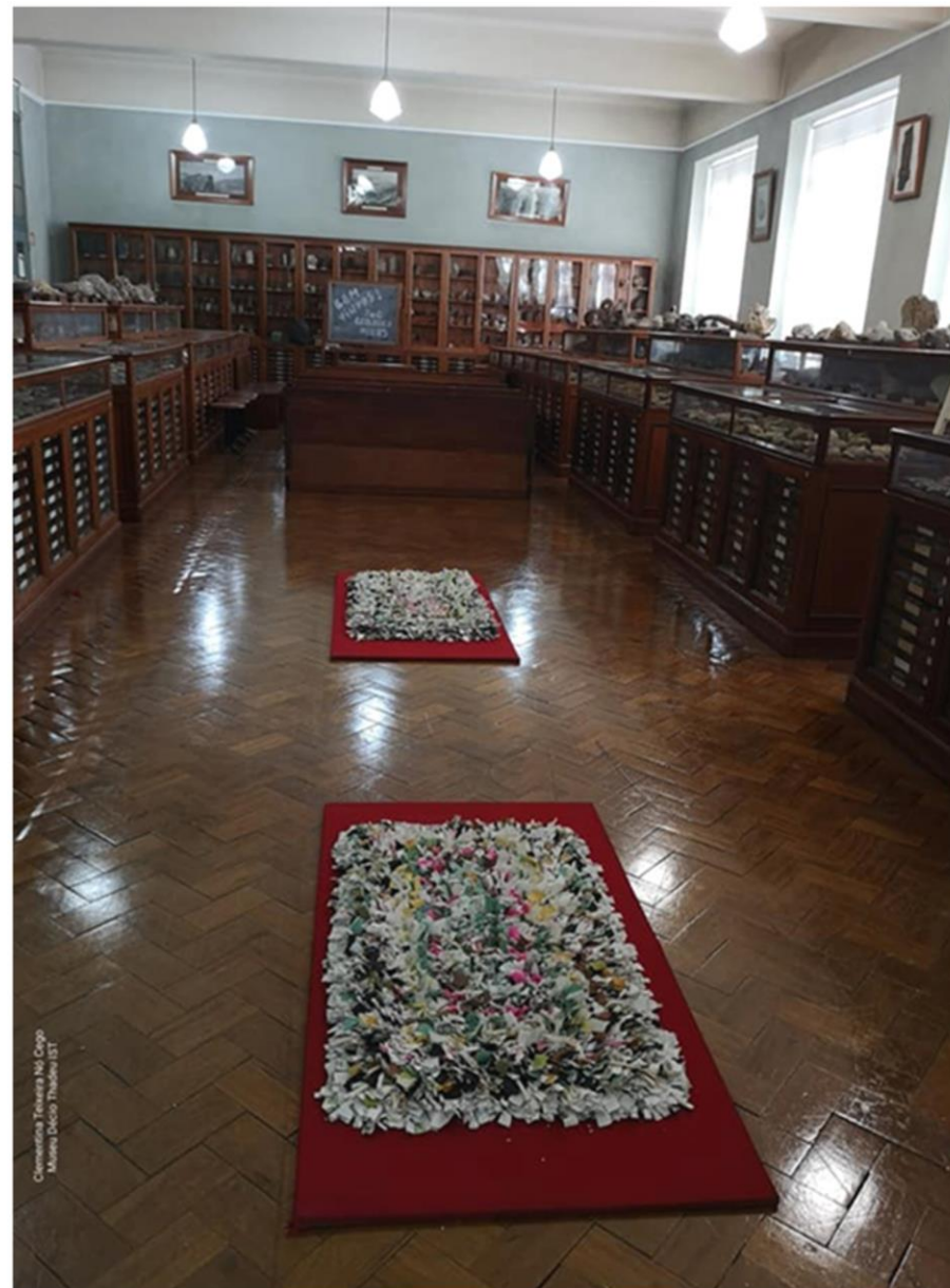
Clemencia Teixeira M. Cogo Museu Deleó Thales ST