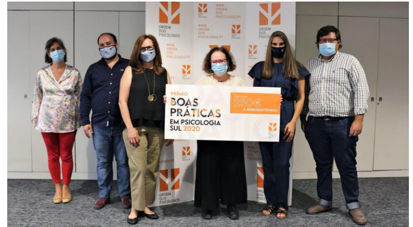
Prémio Boas Práticas pela Ordem dos Psicólogos Portugueses