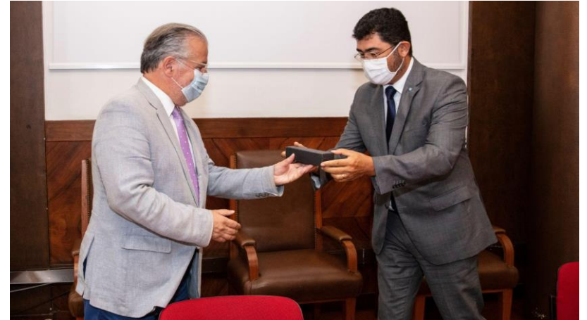
Assinatura do Protocolo com a Faculdade de Psicologia da Ulisboa